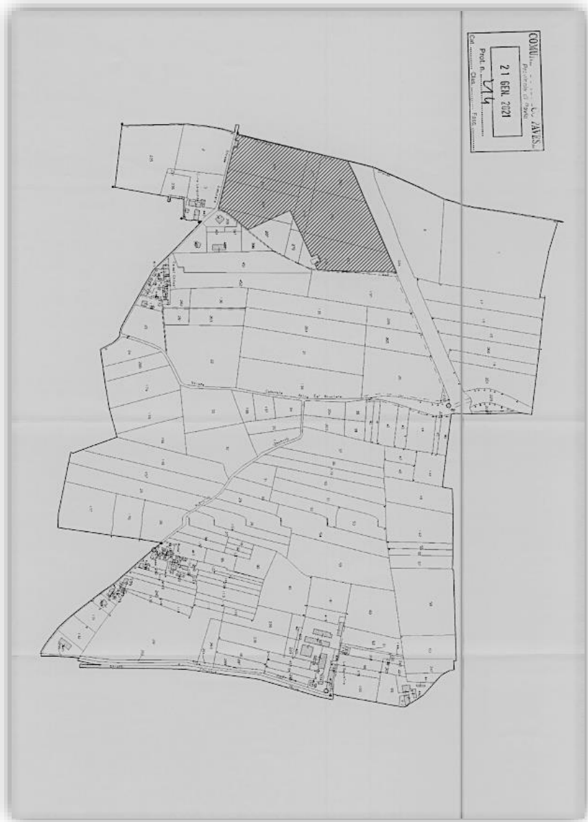
Estratto catastale ambito GSM 2